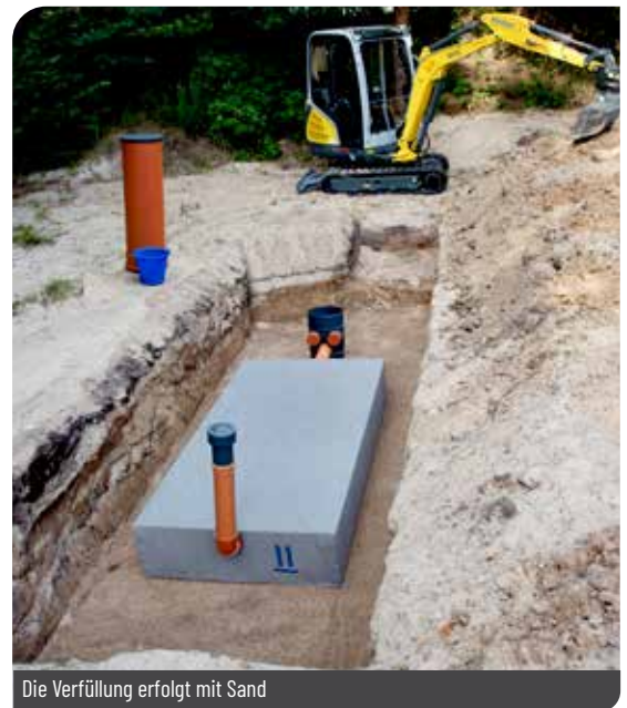
Die Verfüllung erfolgt mit Sand

Durch ihre hohe Stabilität können die Fertigmodule auch unterhalb von LKW-befahrenen Flächen eingebaut werden.